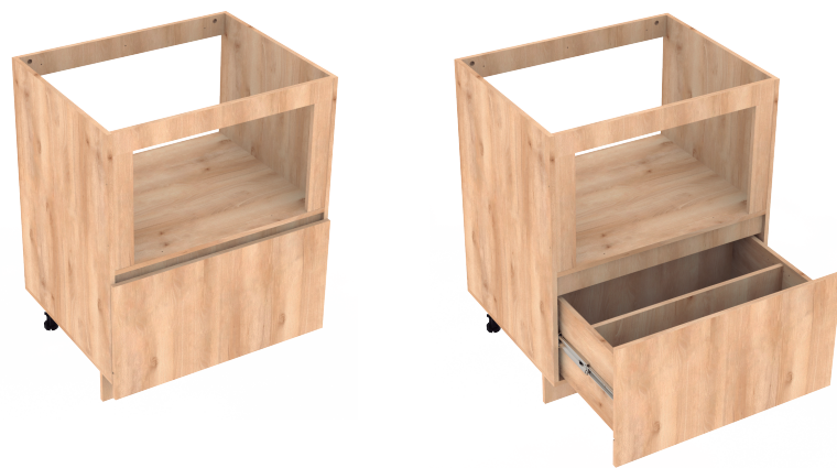
Vista lateral / Lateral view